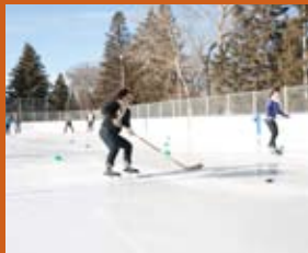
Lancement En Action