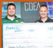
Bourse Le Blanc-Cholette