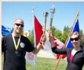
Jeux francophones de l'Alberta