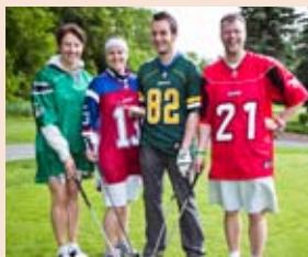
Golf par excellence