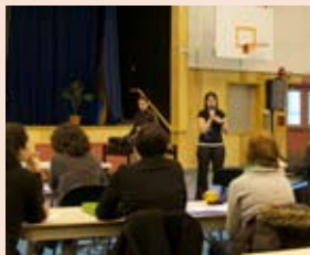
OASIS au Yukon