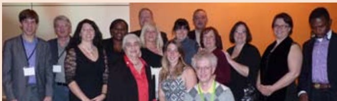
Délégation albertaine au Rendez-vous santé 2012