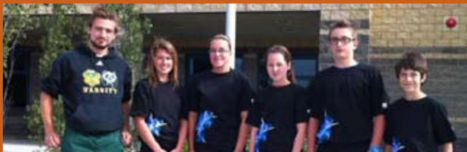
Clinique sportive de cross-country à St-Paul