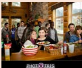
Potluck santé En Action à Canmore